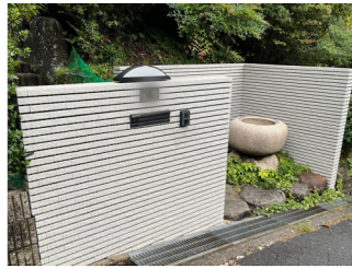
石壁 汚れの種類：カビ・すす汚れ