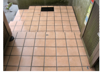
タイル 汚れの種類：カビ・水垢