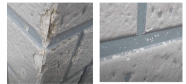
※ 高圧洗浄によるサイディングのダメージ

カビや汚れに対して、漂白や剥離をするのではなく、科学の力で徹底的に「分解」します。高圧洗浄とは異なり、建材を傷めることなく汚れを落とします。